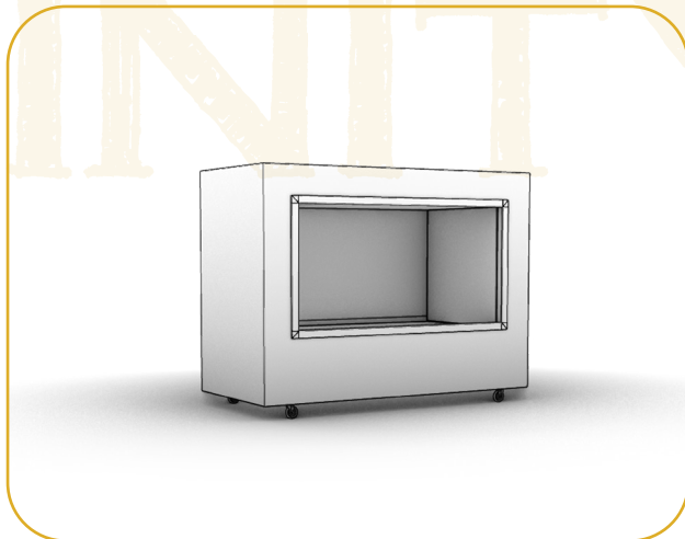
La Esencia | Módulo básico

Módulo compacto formado por contenedores reducidos y estructuras plegables que se adaptan a cualquier tipo de sala con puertas de 1,20x2,10 m.